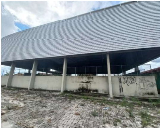
FOTO 43 - Quadra Poliesportiva - Vista Externa