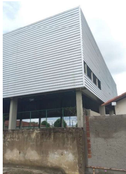
FOTO 44 - Quadra Poliesportiva - Fechamento lateral necessitando de pequenos reparos