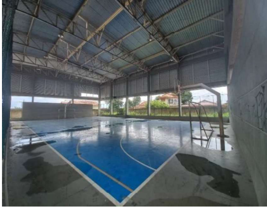
FOTO 45 - Quadra Poliesportiva - Vista Interna