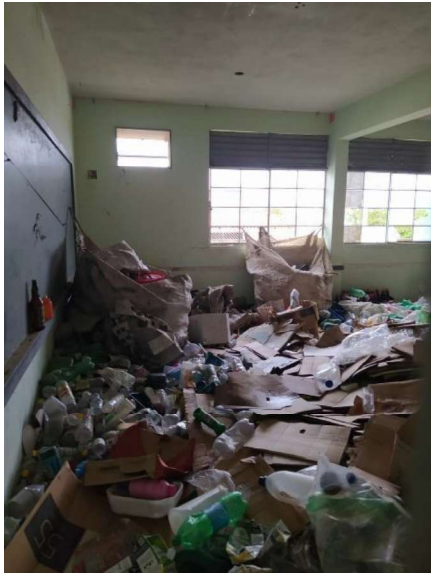
FOTO 41 - Acúmulo de Lixo na Sala