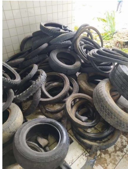
FOTO 42 - Pneus acumulados na área de circulação interna