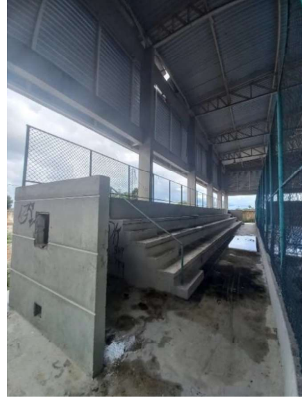
FOTO 46 - Arquibancada - Quadra Poliesportiva